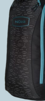
RUCKSACK BLUE L 1630 GRAMM 165 L