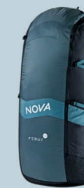
FERUS 105 820 GRAMM 105 L