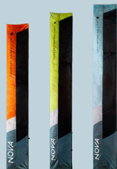
CONCERTINA BAG LIGHT S 328 | M 418 | L 482 GRAMM Farben können variieren