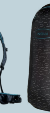
RUCKSACK BLUE S 1420 GRAMM 110 L