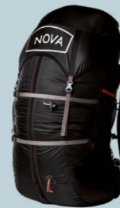
INVERTO 985 GRAMM 60 L