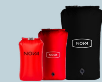
COMPRESSION BAGS ULTRALIGHT 22 L | 34 GRAMM GRÖSSE S/M 30 L | 120 GRAMM GRÖSSE M/L 60 L | 140 GRAMM