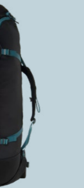
RUCKSACK BLUE M 1520 GRAMM 145 L