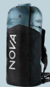
X-PACK 50 525 GRAMM 50 L (+10)