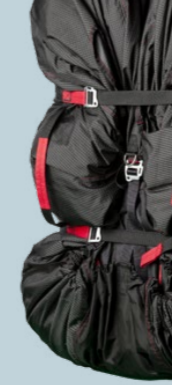
CITO 1400 GRAMM CA. 180 L