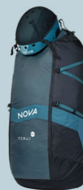
FERUS 80 760 GRAMM 80 L