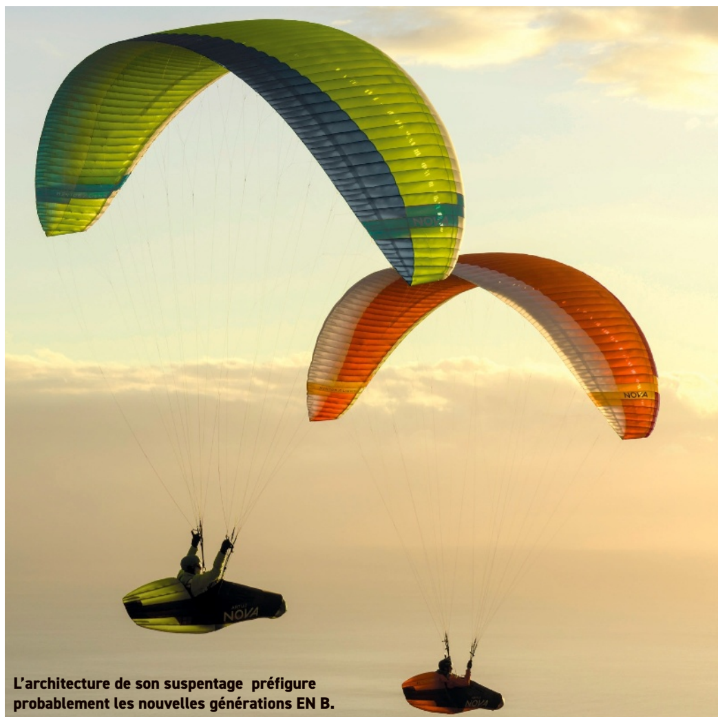
L'architecture de son suspentage préfigure probablement les nouvelles générations EN B.

La structure interne complexe offre une large bande de bridage sur l'envergure, au niveau de la ligne B. Le bord d'attaque accueille des joncs bien plus longs que d'habitude (impliquant donc un pliage soigné, cellule par cellule, avec l'usage d'un boudin gonflé pour préserver la courbure). Ici, pas de Nitinol, mais une fibre assez rigide. Le bout d'aile, en 2 lignes donc, se termine par une pyramide sophistiquée et se trouve relié directement aux avants sur l'élévateur (suspente B3, on va en reparler). Les élévateurs, très propres, intègrent le pilotage sur l'incidence via une barrette carbone (sur les élévateurs C, réglables en hauteur et démontables). Le système présente un élévateur B plus long,